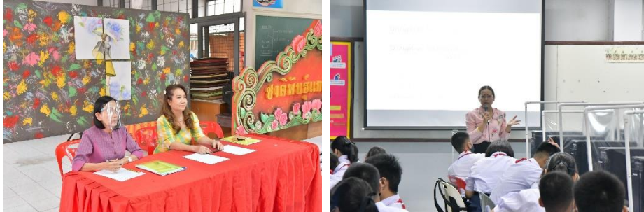
คณะศึกษานิเทศจาก สพม.3 มานีเทศ ครูผู้สอน