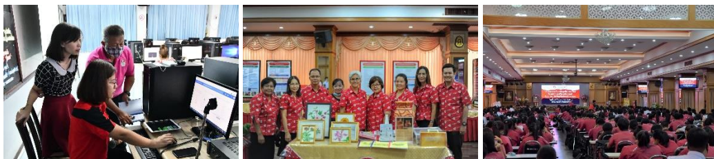
ส่งเสริมสนับสนุนสภาพแวดล้อมที่เอื้ออำนวยและสนับสนุนการปฏิบัติงานของครู และบุคลากรทางการศึกษา

๕. ด้านการแสดงผลการรับผิดชอบที่ตรวจสอบได้ ผู้บริหาร ข้าราชการครูและบุคลากรทางการศึกษาในโรงเรียนปากเกร็ดมีความมุ่งมั่นตั้งใจปฏิบัติราชการอย่างมีประสิทธิภาพ และมีความรับผิดชอบต่อผลการปฏิบัติงาน