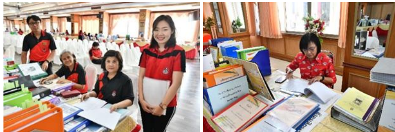
นิเทศติดตามและประเมินผลการปฏิบัติงาน ทั้งประเมินรายบุคคลและการดำเนินงานของโรงเรียนในด้านต่างๆ