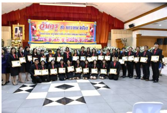
ครูได้รับเกียรติบัตรเพื่อยกย่องเชิดชูเกียรติ ครูดีเด่นด้านการเรียนการสอน และครูดีไม่มีอบายมุข และประกาศเกียรติคุณทางการศึกษา เนื่องในวันครูแห่งชาติ ประจำปี 2563

๔. ด้านคุณธรรมการทำงานในหน่วยงาน การมีระบบการบริหารงานตามหลักธรรมาภิบาลและ คุณธรรมในการบริหารงาน